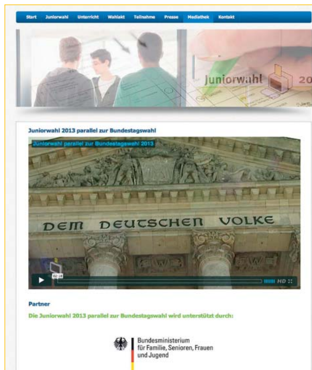
Abb. 5 »Juniorwahl.de«. Die bundesweite Initiative Juniorwahl ist eine Initiative des Kumulus e.V. – Der Kumulus e.V. ist ein gemeinnütziger und überparteilicher eingetragener Verein. Seit 1999 führt er in Zusammenarbeit mit zumeist Kultusministerien simulative Wahlen parallel zu offiziellen Wahlen an Schulen für Schülerinnen und Schüler unter 18 Jahren durch. Bei der Bundestagswahl 2009 beteiligten sich insgesamt 1.043 Schulen und 246.616 Schülerinnen und Schüler, womit die Juniorwahl zu den größten Schulprojekten in Deutschland zählt. Im Jahr 2013 parallel zur Bundestagswahl sollen es bundesweit 5.000 Schulen und damit 25 Prozent aller weiterführenden Schulen in Deutschland werden.

Hurrelmann: Abschließend könnte man sagen, eine Herabsetzung des Wahlalters kann dadurch begründet werden, dass man sieht, man kann im Alter von 16 Jahren heute einschätzen, was es bedeutet, eine Stimme abzugeben. Man hat in diesem Alter die intellektuelle, aber auch die soziale Urteilsfähigkeit. Das halte ich für das entscheidende Argument. Da bedeutet nicht etwa die allgemeine Reife, wie oft gesagt wird. Die wird ja auch bei anderen Menschen, die vielleicht psychische Probleme haben, nicht einge-